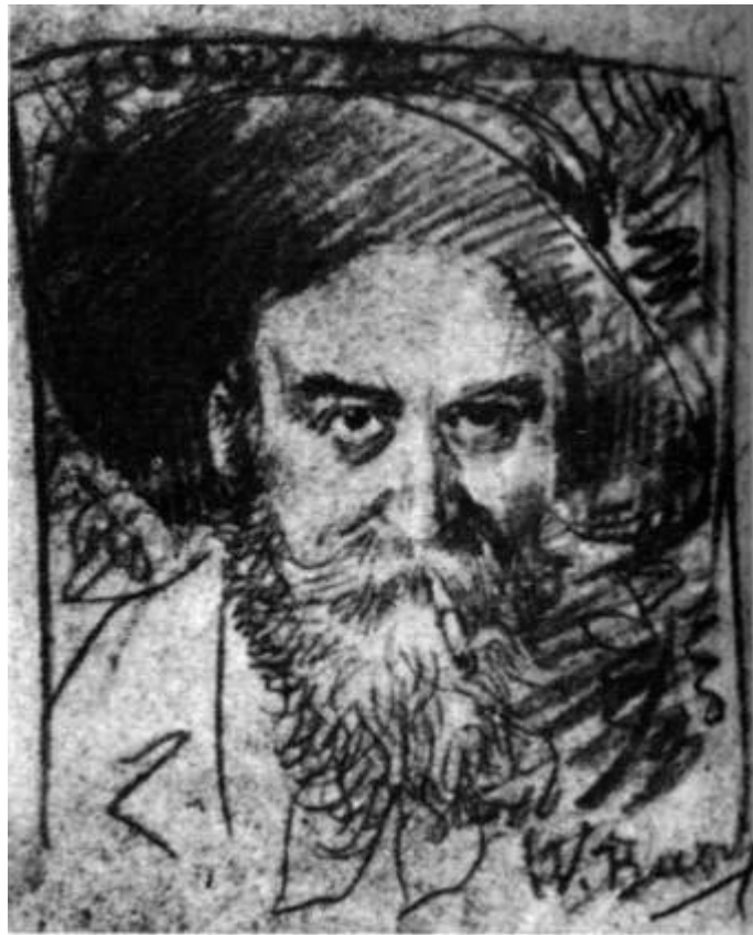
Letztes Selbstbildnis Buschs

Heiligkreuzsteinach 1999, erweitert 2001